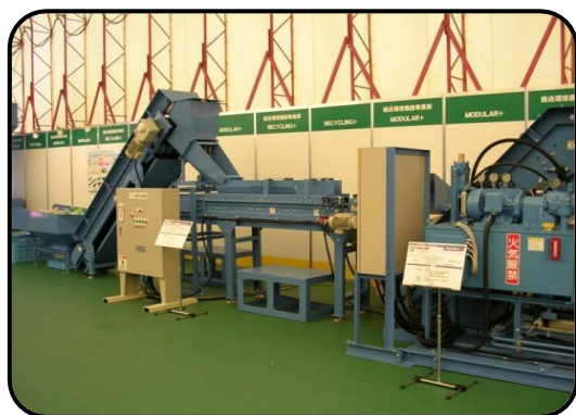
空き缶・ペットボトル選別装置