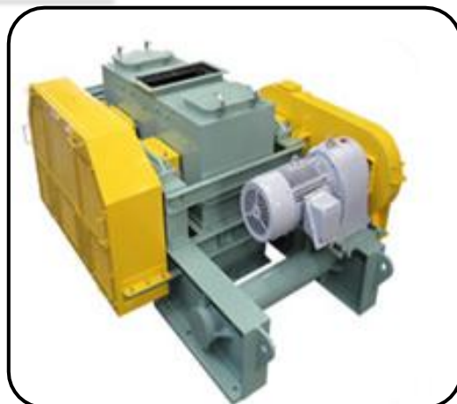
ロール式破碎機 「ロールプレーカー」