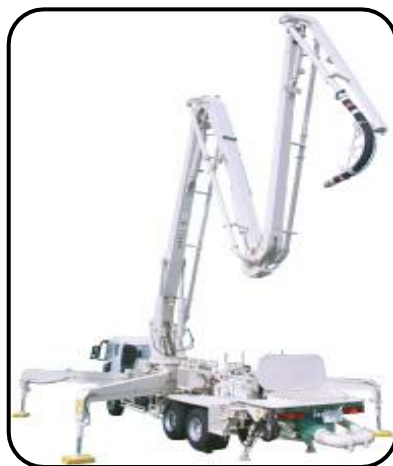
コンクリートポンプ車