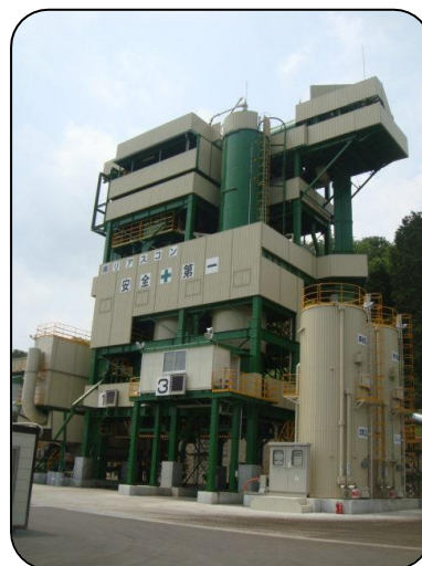
宮城県で稼働中の アスファルトプラント ユーロAP NAP・EBD-1606-4251D