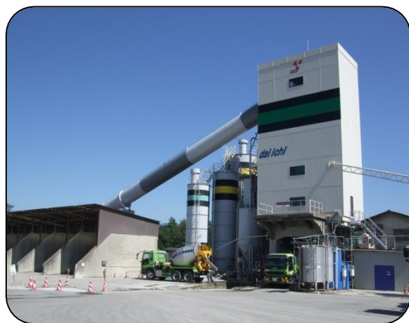
コンクリートプラント