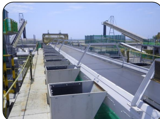
震災ガレキ選別コンベヤ