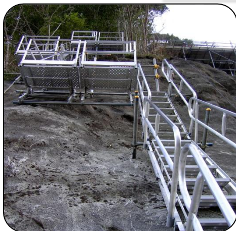
斜面用安全昇降システム