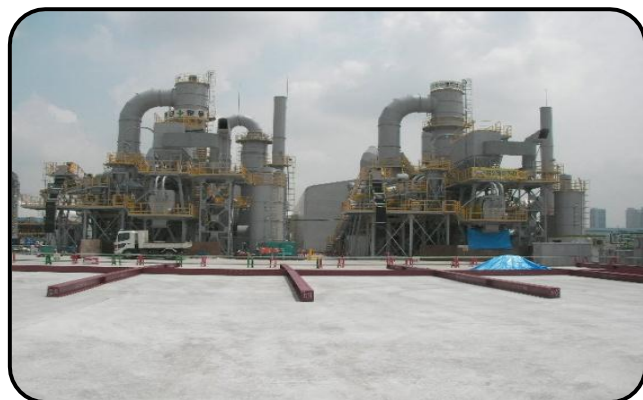
豊洲新市場建設予定地で稼働中の 油汚染土壌浄化処理プラント NTR-Stage VI